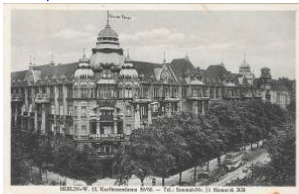
Werbepostkarte, Anfang der 1930er Jahre.