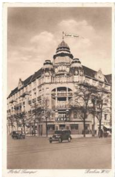
Werbepostkarte, vermutlich nach 1935.